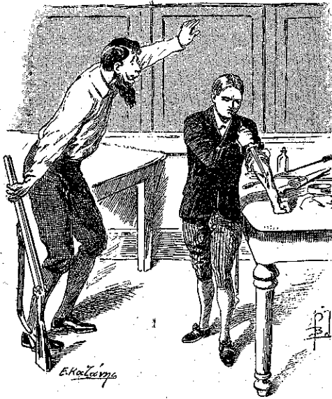
«Εβούλτε γενναίως την άκραν του μαχαριτού εις τον βραχιόνα του...» (Σελ.38 στ. β').

— Είμαι γερός και δυνατός εγώ, είπε· σ' άγγυώμαι !